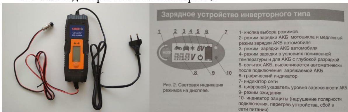
Рис.5 Зарядное устройство 220В и его индикация

Внешний вид Устройства показан на рис. 5.